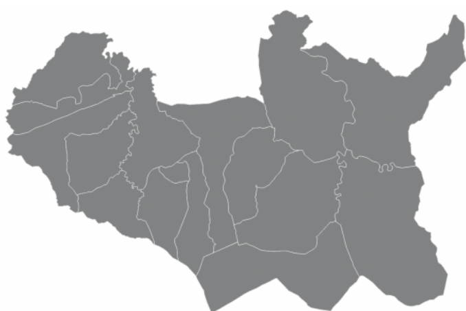
COORDENADAS GEOGRÁFICAS: 40.899192;-8.361809