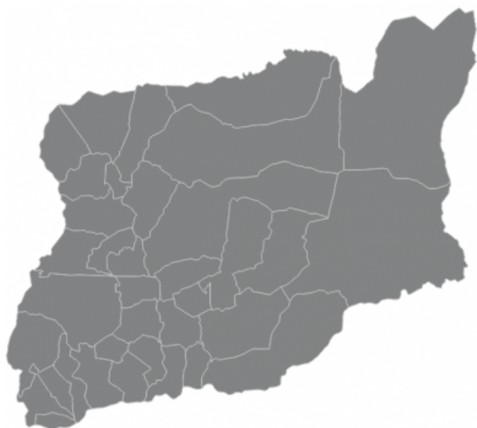
COORDENADAS GEOGRÁFICAS: 41.800763;-8.478202