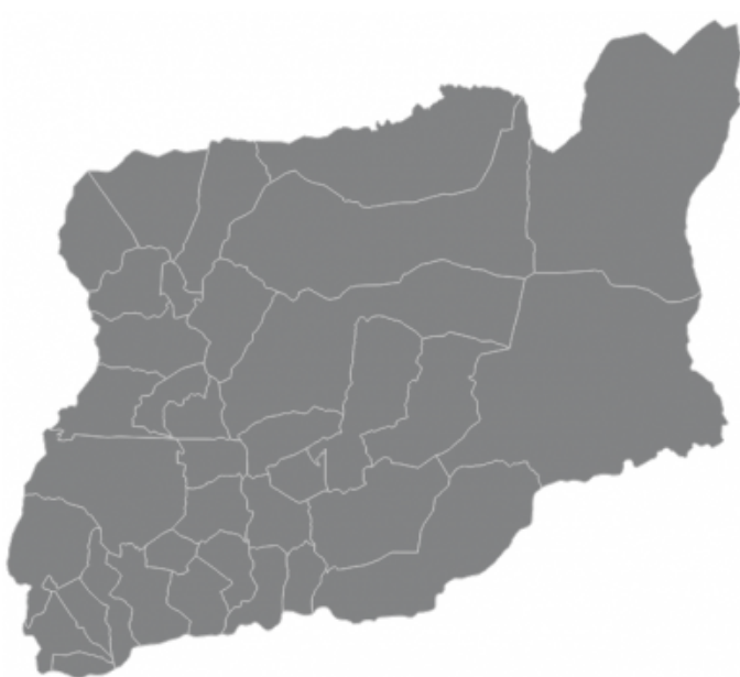
COORDENADAS GEOGRÁFICAS: 41.921098;-8.437268