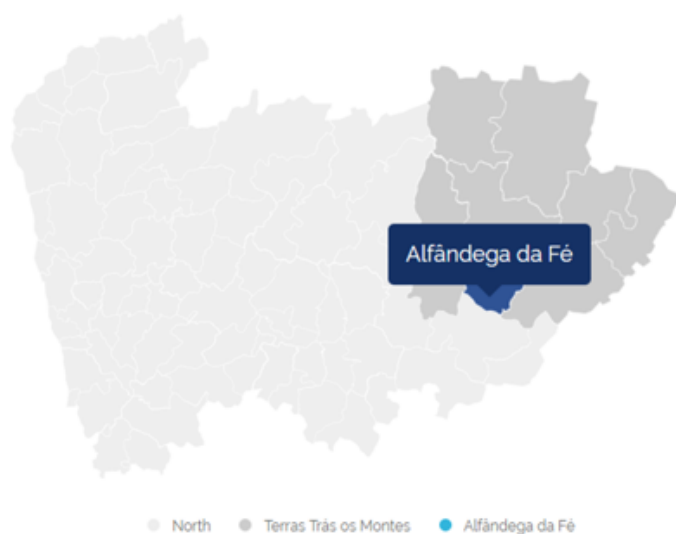
COORDENADAS GEOGRÁFICAS: 41.473309;-6.463669