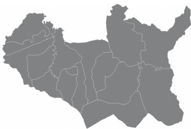
COORDENADAS GEOGRÁFICAS: 40.944493;-8.402354