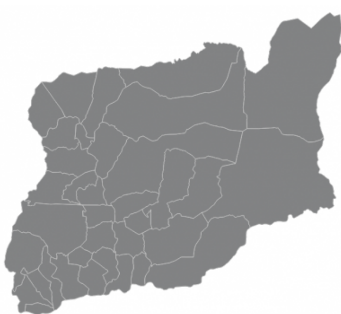
COORDENADAS GEOGRÁFICAS: 41.816946;-8.413539