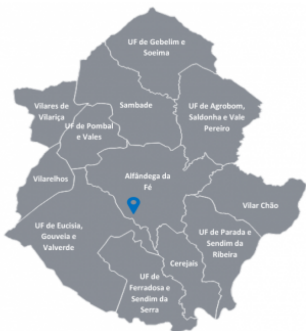
■ Freguesias do Município de Alfândega da Fé