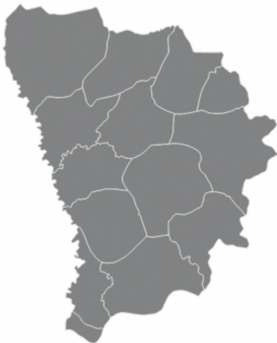
COORDENADAS GEOGRÁFICAS: 41.311504;-7.463219