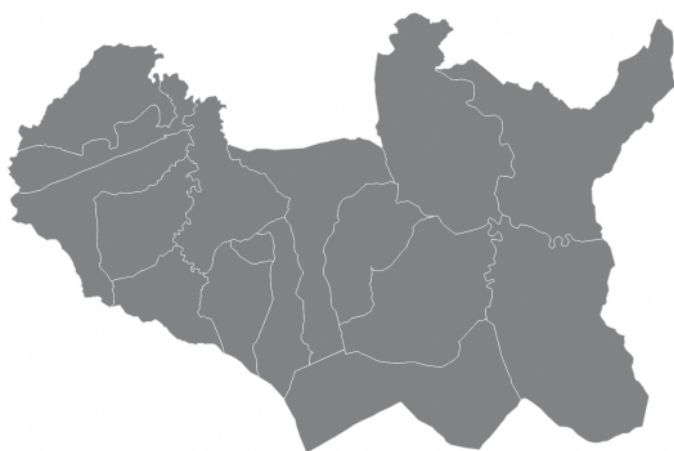
COORDENADAS GEOGRÁFICAS: 40.957868;-8.14768