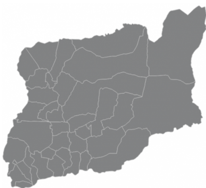
COORDENADAS GEOGRÁFICAS: 41.921098;-8.437268